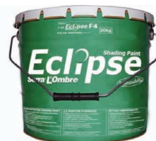
Poids Net 20 Kg

Eclipse assure l'ombrage d'une saison et régule la lumière, la température et l'hygrométrie des serres verre, polycarbonate et tunnels plastique.